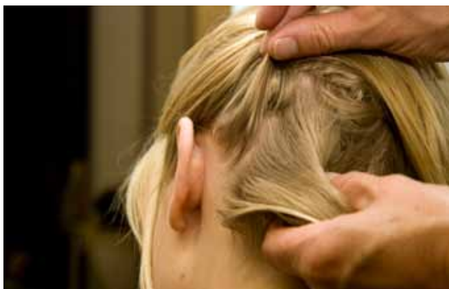
Als u op hoofdluis controleert, kijk dan goed tussen de haren.