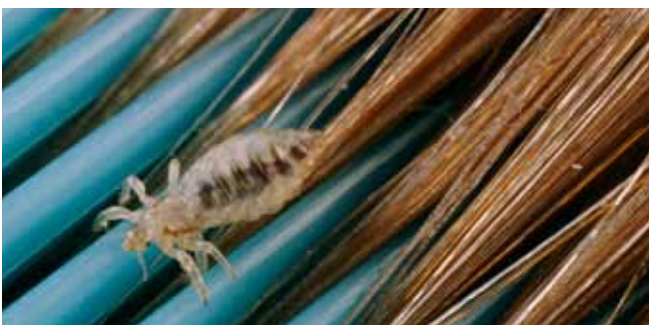
Een hoofdluis op een kam.

De volwassen luis is een grijsblauw beestje van ongeveer 3 millimeter groot. Nadat hij bloed opgezogen heeft, is hij roodbruin. De eitjes, neten, zien eruit als grijswitte puntjes en kleven aan de haren. Ze zijn lastig te verwijderen. Neten die dichtbij de hoofdhuid zitten, bevatten eitjes. Zolang deze volle neten in het haar zitten, blijven er luizen geboren worden. Zitten ze een paar cm van de hoofdhuid vandaan, dan zijn ze uitgekomen en leeg. Als het haar groeit, komen de lege neten steeds verder van de hoofdhuid af te zitten.