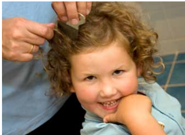
De uitkammethode is het meest natuurlijke middel tegen hoofdluis

In de vorm van shampoos, sprays, crèmes en lotions zijn verschillende producten te verkrijgen. Het verschil tussen de producten heeft vooral te maken met de werkzame stof die erin zit. Op dit moment biedt geen enkel antihoofdluismiddel 100 % 'garantie'. Informeer naar bijwerkingen en contra-indicaties, want kinderen met hooikoorts, cara of eczeem kunnen gevoelig zijn voor één van de werkzame stoffen. Lees ook de bijsluiter goed door en volg de werkwijze die daarin staat. Na 1 week dient u de behandeling met het antihoofdluismiddel te herhalen. Bovendien moet de behandeling met antihoofdluismiddelen gecombineerd worden met de uitkammethode: twee weken het haar dagelijks doorkammen met een fijntandige kam, in combinatie met crèmespoeling.