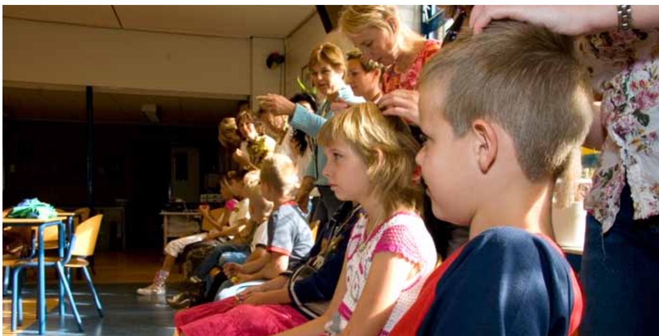
Een ouderwerkgroep kan op school de kinderen regelmatig controleren.

Niet alle ouders willen dat hun kind gecontroleerd wordt door een andere ouder. De school kan dit ondervangen door de luizencontrole in het schoolreglement op te nemen. Daarnaast kunnen ouders én kinderen gestimuleerd worden om regelmatig te controleren op hoofdluis, en hoofdluis te melden aan de school. Als een kind hoofdluis heeft, is het verstandig om alle kinderen uit die groep een informatiebrief over hoofdluis mee naar huis te geven.