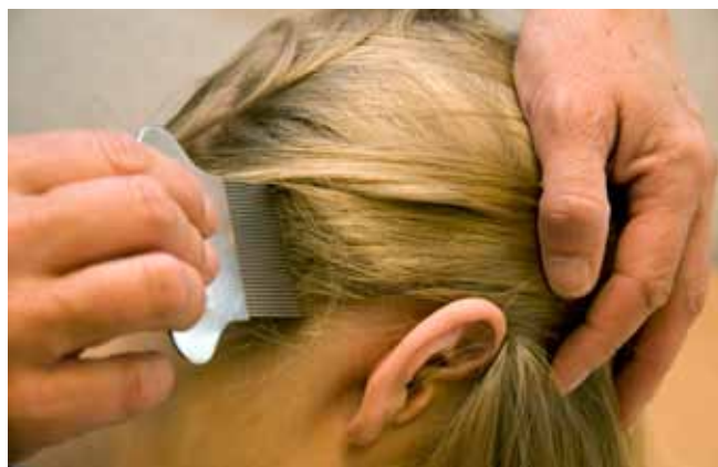
Kam het haar met een fijntandige kam boven een wit papier of de wasbak.